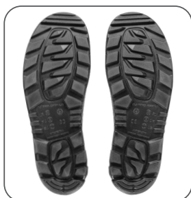
podešev podošva outsole podeszwa